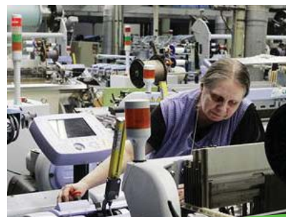
Situace v textilním průmyslu v ČR str. 4