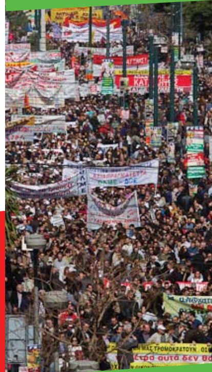
Analýza situace v Řecku str. 9 - 12