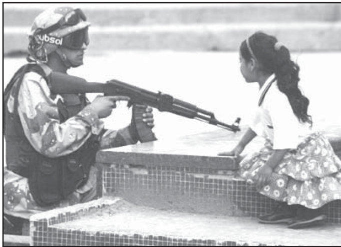
Přivezli jsme vám demokracii...

té, konferenci financuje Saddámova dcera, nelze připustit konání konference, zejména ne na půdě parlamentu“). Opět přišel ke slovu služebníčkovský stereotyp. Pravice ani tentokrát neprojevila schopnost objektivně analyzovat situaci a samostatně uvažovat.