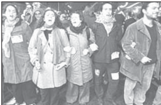
Jednotní na ulicích - ale jak dál?

Socialistické internacionály, bojovníci za lepší svět. Jejím jediným poselstvím je udržet status quo, tj. posilovat pozici firem na úkor zaměstnanců a celé společnosti. Na rozdíl od svého pravcového kandidáta Nicolase Sarkozyho za Svaz pro lidové hnutí (UMP) u Segolen nehrozí, že by její rozhodnutí vyprovokovala ma-