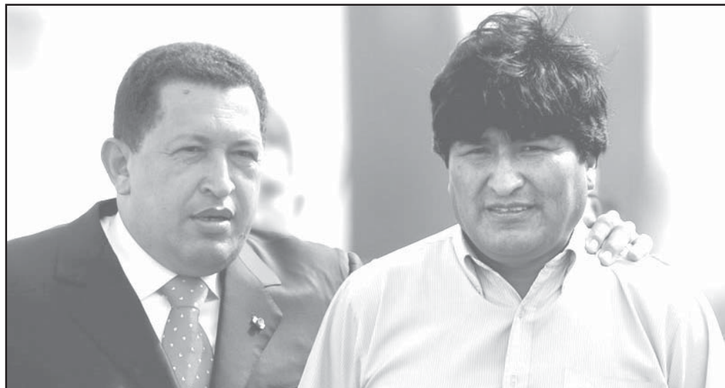
Hugo Chávez a Evo Morales: symboly jiné Jižní Ameriky.

V Peru byl letos za prezidenta zvolen Alan Garcia, který čelí obvinění z porušování lidských práv a masivní korupce. V Chile se k moci dostala dcera po politikovi, který byl umučen při výslechu Pinochetovými hrdlořezi, Michelle Bachelet. Brazílie dala zelenou Lula da Silvovi. V těžce zkoušené Nikaragui dali voliči další šanci ostřílenému politickému matadorovi Danielovi Ortegovi. Ekvádorským prezidentem se stal kandidát tíhnoucí k levici Rafael Correa. Svůj prezidentský post letos obhájil i Chávez ve Venezuele. Kolumbie zůstává nadále v pařátech proamerického diktátora Uribeho, kokainových bosů, zdaněných peněz obyvatel USA a humanitárním chaosu.