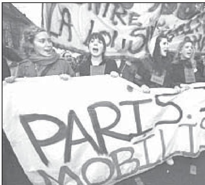
Duch jednoty i radikálnosti jde dne ve Francii ruku v ruce

Na celém francouzském hnutí proti Euroústavě je zajímavá jeho šíře. V „Kolektivěch 29.května“ se setkali rebelující socialisté z hnutí Pour la Republique social (PRS) 1 , aktivisté nejrůznějších občanských hnutí, Zelení, odboráři i revolucionáři z LCR (Ligue communiste revolutionnaire) 2 a komunisté. Díky této jednotě a také díky jasně levicové kritice, která byla na honu vzdálena zprávy o tom, že se Francouzi bojí polských instalatérů, se podařilo tento neoliberalní projekt zastavit. Co více, pro mnoho dříve apolitických či neangažovaných lidí se poli-