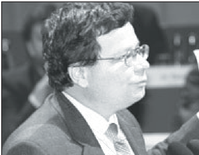
Vondra: poplatný USA ostře napadal konání konference.

Další informace o konferenci a některá důležitá vystoupení lze najít na serverech http://blistry.cz a www publica.cz