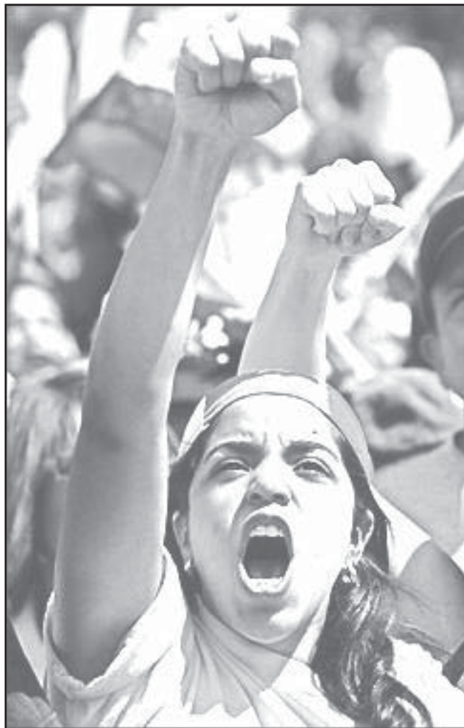
Hnutí zdola si prosadilo změnu vývoje ve svých zemích.

Na počátku 60. let minulého století pokládala Kennedyho administrativa Latinskou Ameriku (od Mexika po Ohňovou zemi) za natolik důležitou součást amerického impéria, že bylo třeba ji bedlivěji střežit, aby nedocházelo k jejímu narušování (Kuba). „Obrana hemisféry,“ se změnila v „obranu vnitřní bezpečnosti,“ tedy v jakousi nedobytnou tvrz před komunistickou hrozbou. Ve skutečnosti šlo o vyhlášení vyhlazovací války domorodé populaci, tedy chudým rolníkům, bezzemkům, dělnickým odborům, církevním